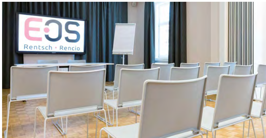
Der Akademiesaal der EOS Genossenschaft in Bozen – Rentsch

La storia di IARTS può annoverare più di 20 anni di iniziative di successo. L'Istituto è stato fondato nel 1995 ed ha come attività principale l'organizzazione e la promozione di corsi di formazione e aggiornamento, congressi, supervisioni seminari e gruppi di studio.