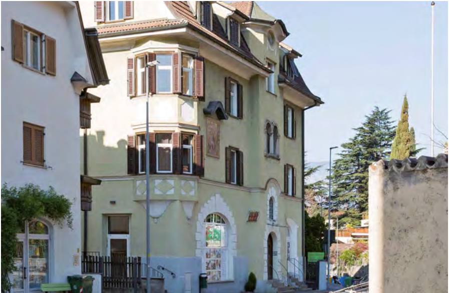
Der Sitz des IARTS im Haus der EOS Genossenschaft in Bozen – Rentsch

Dalla sua fondazione nel 1995, l'Istituto ha posto particolare enfasi sul bilinguismo in tutti gli eventi formativi sfruttando questa particolarità locale come risorsa preziosa. Il nostro programma in lingua tedesca e italiana si rivolge quindi anche a partecipanti oltre i confini regionali dell'Alto Adige.